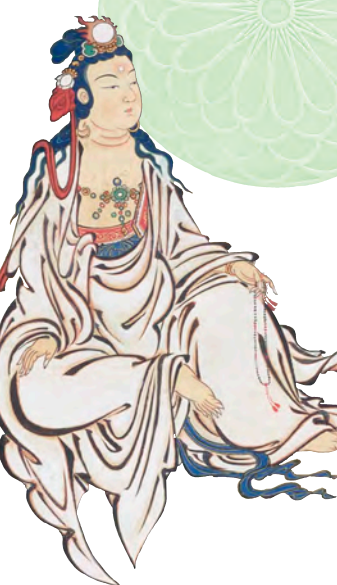
観音三十三変相図 文室宗言筆 三十三幅のうち婦女身 相国寺蔵

令和五年(二〇二三)は、臨済宗の尼僧、無外如大(むがいによだい 一二二三〜一二九八)尼の生誕八〇〇年にあたります。彼女 は、臨済宗において女性で、仏光国師無学祖元の法を継いだ最 初の尼とされています。十刹に列せられる相国寺派寺院、真如 寺の歴史をたどると、弘安九年(一二八六)に無外如大によつて 創庵された「正脈庵(しょうみやくあん)」にさかのぼります。また、 真如寺は十六世紀後半からは宝鏡寺門跡の善提所となり、その 寺宝は尼門跡の典雅な文化を今に伝えます。今回は照山元瑠 尼、徳巖理豊尼や逸巖理秀尼など、出家した皇女達のゆかりの 品をご覧いただけます。 相国寺派寺院伝来の寺宝から、無外如大尼の時代から近世 に至るまでの女性と仏教のかかわりを探ります。