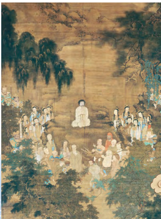
世尊説相図 月光筆 相国寺蔵

新型コロナウイルス感染拡大防止のため、会期の変更に 変更を行う場合があります。 最新の情報は当館ホームページでご確認ください。 ご来館にあたっては、新型コロナウイルス感染拡大 防止にご理解とご協力をお願い申し上げます。 ・来館時はマスクを着用ください。 ・美術館入口で検温を実施いたします。37.5度以上 の発熱が認められた場合は入館をご遠慮ください。 「関連イベント」 当館ホームページでご確認ください。