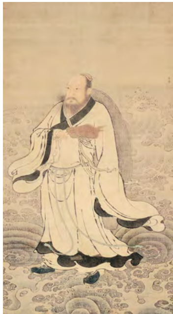
陳南先生浮浪図 劉俊筆 相国寺蔵 (1期)