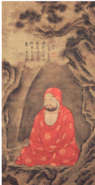
重要文化財 洞窟達磨図 無象静照賛 鹿苑寺蔵 (1期)

寺院空間を荘厳する様々な作品の意匠には、中国の故事由 来の画題も多く取り入れられました。本展観では、仏教説話や 漢故事を好んだ禅僧たちの詩文や寺院に伝来する絵画・工芸 から、禅林につたわる様々なものがたりを概観いたします。