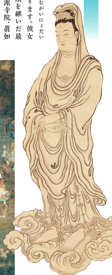
観音像 照山元瑠筆 瑞春院蔵 (II期)