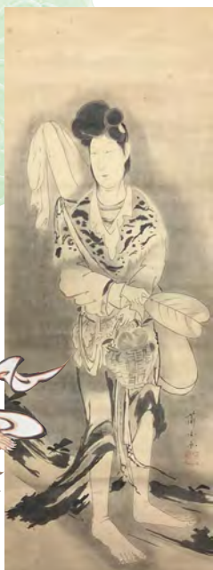
西王母図 曾我蕭白筆 慈照寺蔵 (II期)