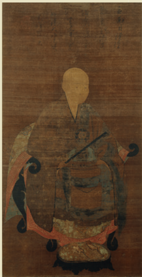
高峰顕日頂相 自賛 鎌倉時代 相国寺蔵 通期