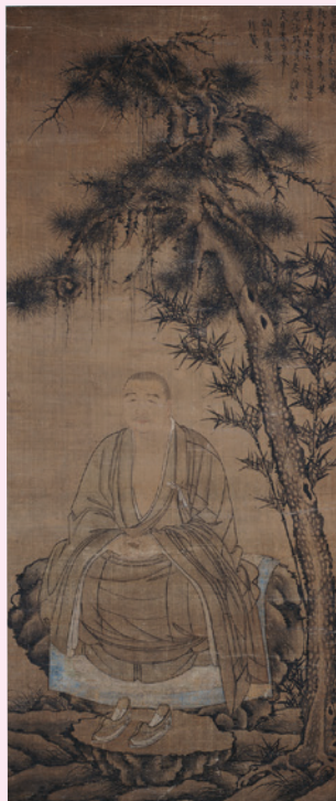
中峰明本頂相 中国・元時代 慈照院蔵 II期

【講座】 I期 ● 4月27日(土) 14:00～15:30 「相国寺の年中行事の荘厳と頂相」 II期 ● 7月20日(土) 14:00～15:30 「頂相が制作される時——近世前期を中心に」 講師…本多潤子(当館学芸員) 場所…当館二階講堂(13:30開場) 定員…先着80名 ※当日の拝観券が必要です。