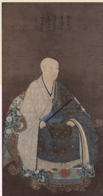
重要文化財 春屋妙葩頂相 自賛 室町時代 慈照寺蔵 I期