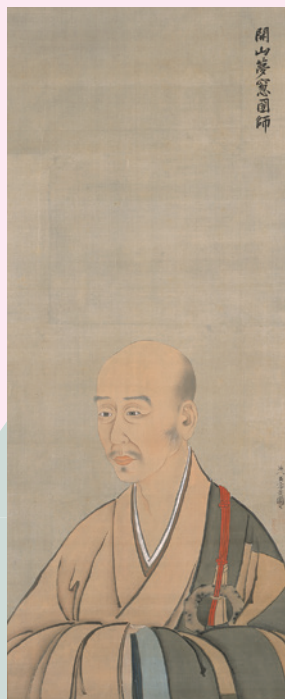
列祖像三十幅 (開山夢窓国師) 海北友雪筆 江戸時代 相国寺蔵 I期