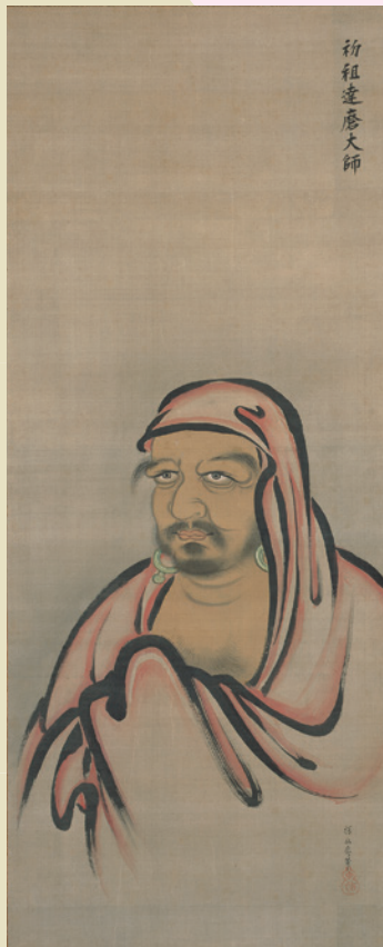
列祖像三十幅 (達磨大師) 狩野探幽筆 相国寺蔵 I期

達磨を初祖に仰ぐ禅の教えは師から弟子へ連綿と受け嗣がれ、今にその法脈が受け嗣がれています。相国寺は、夢窓疎石を勧請開山に仰ぎます。その教え、つまり法は鎌倉時代に日本へやってきた無学祖元から日本僧、高峰顕日へ伝えられ、夢窓疎石に嗣がれたものです。法が嗣がれたその象徴として、師の絵姿や袈裟が弟子に渡されます。その絵姿を頂相といします。頂相は法を嗣いだ証であるだけではなく、師の回忌法要の際にもかかわらず、夢窓疎石の遺徳を仰ぐ開山忌、二世の春屋妙葩の普明忌などは、今も相国寺の重要な仏教行事として厳修されています。 本展覧会では、相国寺本山ゆかりの禅僧と、相国寺の塔頭それぞれに育まれた禅僧の営みを、頂相を通してご覧下さい。