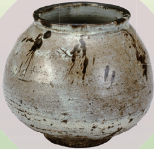
重要文化財 唐津鉄斑文水指 相国寺蔵 Ⅱ期