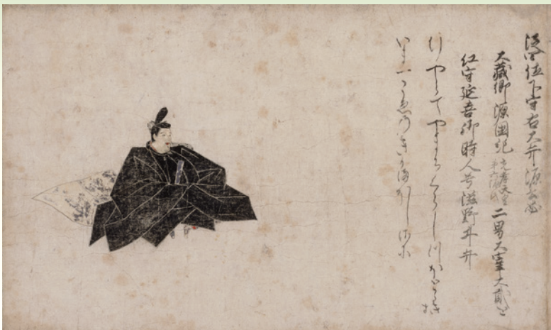
重要文化財 佐竹本三十六歌仙絵 断簡 源公忠 相国寺蔵 Ⅰ期 表面：国宝 玳瑁散花天文目茶碗 相国寺蔵 Ⅱ期