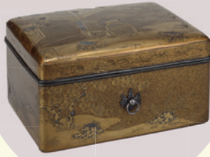
重要文化財 源氏夕顔蒔絵手箱 相国寺蔵 Ⅰ期