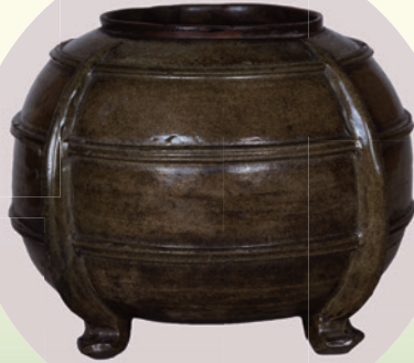
重要文化財 緑釉四足壺 白 織田有楽 贈 听叔顕倅 慈照院蔵