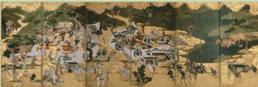
重要文化財 花下游楽図屏風 相国寺蔵 Ⅱ期