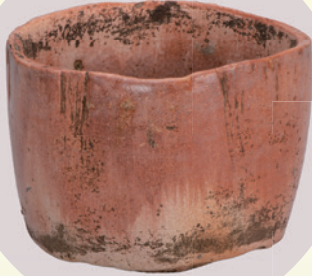
重要文化財 赤染茶碗 加賀 本阿弥光悦造 相国寺蔵 Ⅰ期