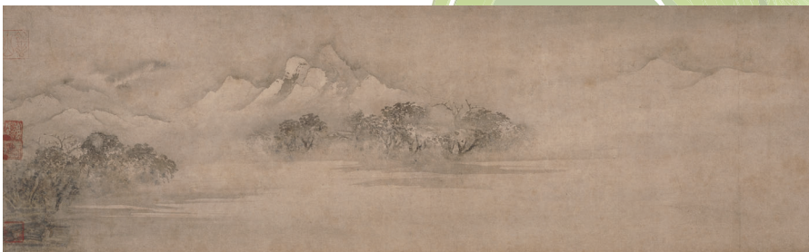
江天暮雪図 牧谿筆 東山御物 紀州徳川家伝来 中国・宋時代 鹿苑寺蔵